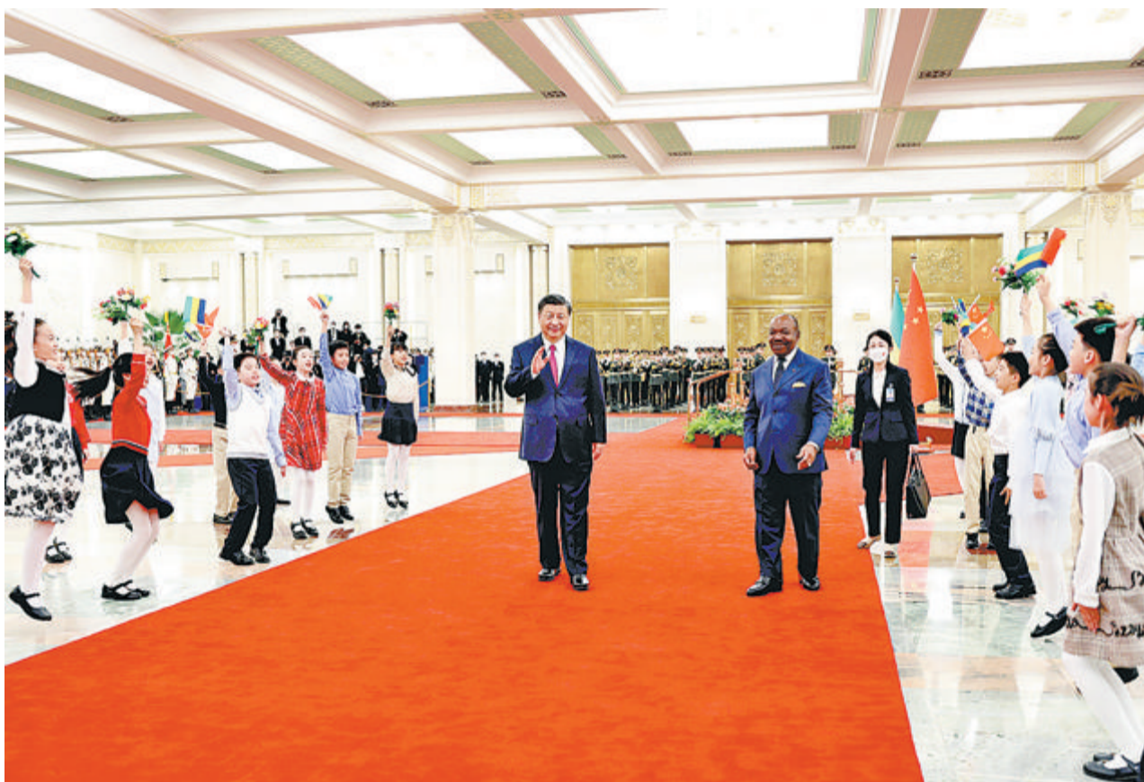
习近平在人民大会堂北大厅为邦戈举行欢迎仪式。

新华社北京4月19日电 4月19日下午，国家主席习近平在人民大会堂同来华进行国事访问的加蓬总统邦戈举行会谈。两国元首决定将中加全面战略合作伙伴关系提升为全面战略合作伙伴关系。 习近平对邦戈访华表示欢迎。习近平指出，明年我们将迎来中加建交50周年。半个世纪来，在两国几代领导人关心引领下，中加友好始终坚如磐石。双方相互坚定支持，维护了两国共同利益和国际公平正义。中国是加蓬的真诚朋友。你此次访华，再次充分体现了中加关系的重要性和高水平。深入、持续推进中加关系，符合两国共同和长远利益，也对推动构建人类命