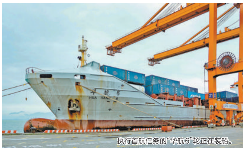
执行首航任务的“华航6”轮正在装船。

本报讯(文/图 记者 汤海波 通讯员 龚小媛)昨日，在鸣响汽笛后，集装箱船“华航6”轮在暮色中徐徐离泊海天码头，驶向台北港，厦门港首条两岸“三通”跨境电商快线正式开通。货值2290万元的60标箱电商货物“夕发朝至”，计划于今早随船抵达台北港。