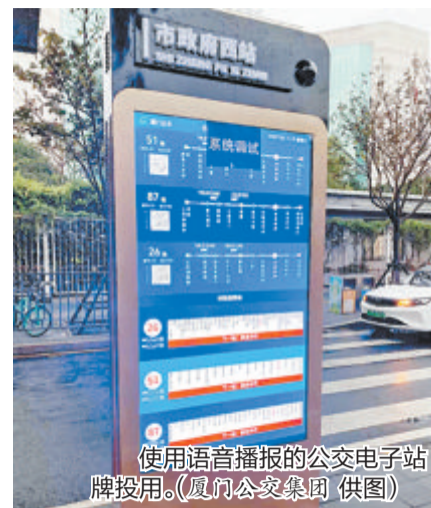
使用语音播报的公交电子站牌投入使用。

本报讯(记者 林钦圣 通讯员 江安娜)首次使用语音播报的4个公交电子站牌日前在厦建成投入使用。