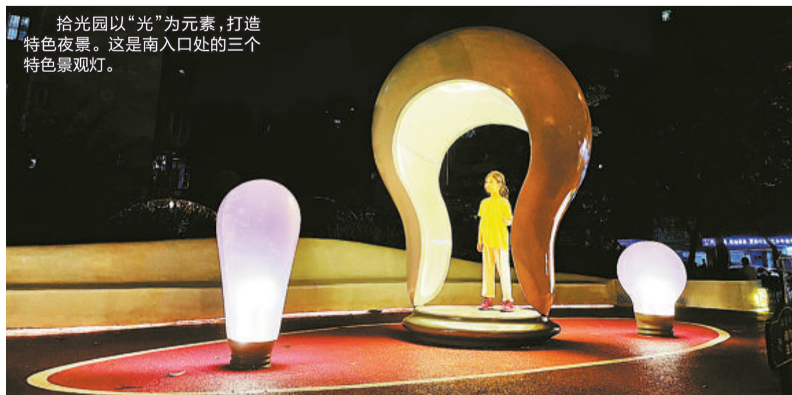
拾光园以“光”为元素,打造特色夜景。这是南入口处的三个特色景观灯。

本报讯(文/图 记者 吴燕如 通讯员 曾骥 庄淑静)经过精心改造提升,原本单一的道路附属绿地变身充满特色的口袋公园。近日,位于长青社区的拾光园建成开放,成为周边居民休闲娱乐的新去处。值得一提的是,根据公园所在地的历史文化,拾光园以“光”为元素,打造特色夜景。