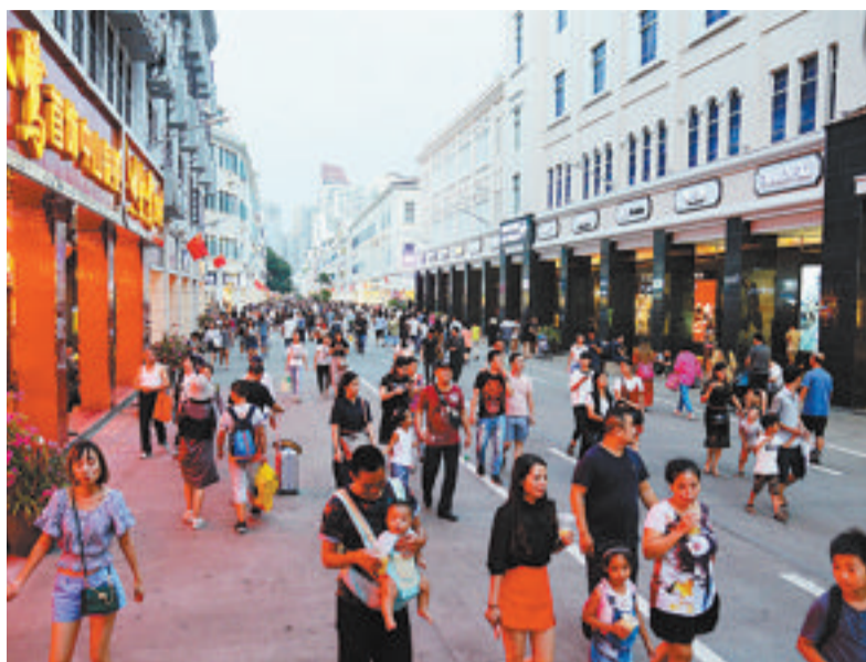
■ 国庆黄金周中山路商圈游客熙来攘往。