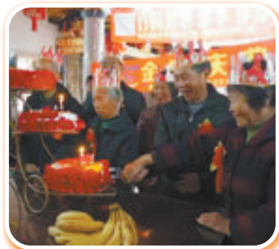
居家服务志愿者为洪厝社区的老人庆祝金婚。

在今年3月8日,洪厝社区为6对金婚夫妇举办了一场鹤发金婚庆祝活动,这场活动就是由社区助老员主导的。吹气球、拉彩带、摆蛋糕……社区助老员带着由志愿者组成的服务团队,为老人准备了蛋糕、水果餐,让他们度过了一个难忘的结婚纪念日。