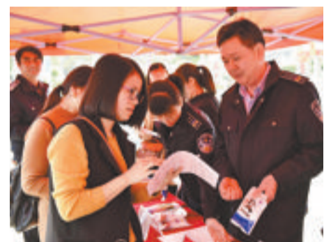
工作人员现场教市民识别假盐。

本报讯(文/记者 陈万泉 通讯员 韩超)昨日上午,同安区2018年3·15国际消费者权益日活动在乐海城市广场拉开序幕。记者了解到,2017年,同安区市场监督管理局共受理各类投诉举报1927起,为消费者挽回经济损失224.64万元,查处经济违法案件214起,罚没款845.3万元。