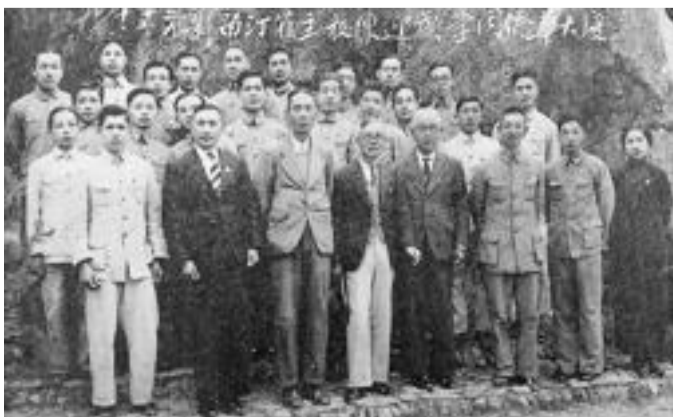
■ 厦大华侨同学欢迎陈嘉庚莅汀视察。（资料照片）

1946年7月12日，厦大校本部在厦门演武场校舍开始办公。厦门市档案馆藏的这份公函，签署人就是接任厦大校长的汪德耀。