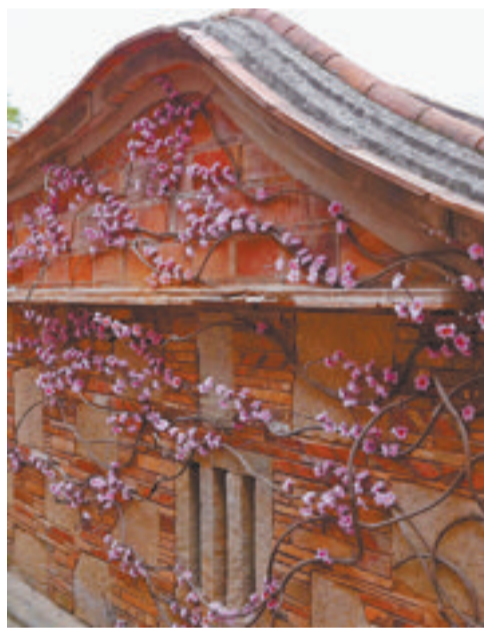
花满古厝 拍摄地：泉州五店