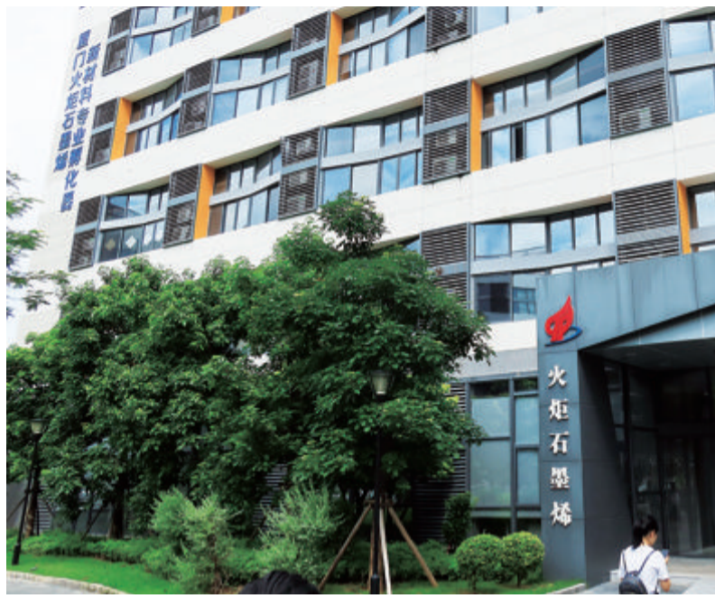
■ 厦门火炬石墨烯新材料创新创业基地。