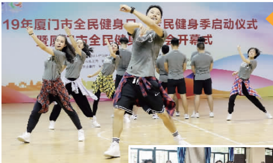
厦门鹭苑广场舞队的队员主要为学校的体育老师和舞蹈老师。

读者节现场,除了热闹的网红广场舞表演,还有酷炫前卫的新科技、汉服巡游快闪、草坪音乐节等精彩活动,都将激发观众身上每一个快乐细胞。10月26日,我们在白鹭洲广场与您不见不散。 S9A16025