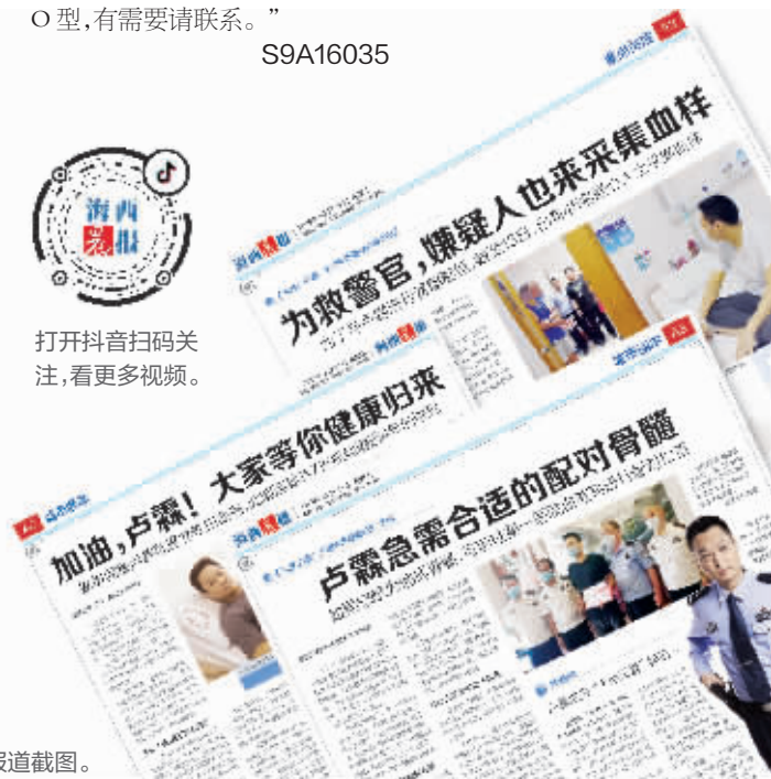
晨报部分报道截图。