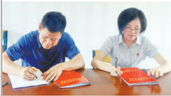
翔安区行政审批局与翔安区工业和信息化局签署行政审批服务事项划转移交接备忘录。

据悉,此次改革坚持“应转必转、应集尽集”和“成熟一项、划转一项”的原则,在充分调研摸底的基础上,合理确定相对集中许可权的范围,首批从工信、教育、财政、建设与交通、农业农村、商务、文旅、档案等8个部门剥离313项区级行政审批服务事项,统一划转区行政审批局集中实施,实现“一枚印章管审批”。