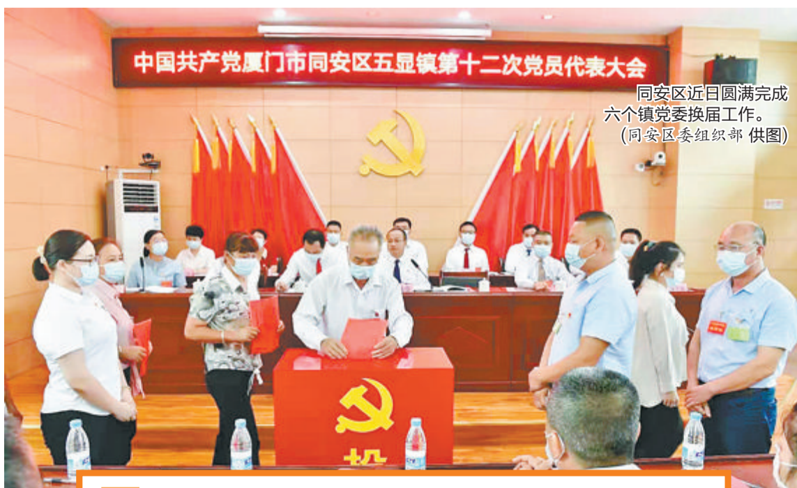
同安区近日圆满完成六个镇党委换届工作。

“有了这份‘作战图’，我们‘按图施工’就能保证选举规范有序，非常方便！”基层换届骨干这样评价《镇领导班子换届工作计划》。大会闭幕后，不少参会代表表示，此次换届，区委高度重视，规范程度前所未有，讨论酝酿非常充分，提出了好建议、选出了好班子。