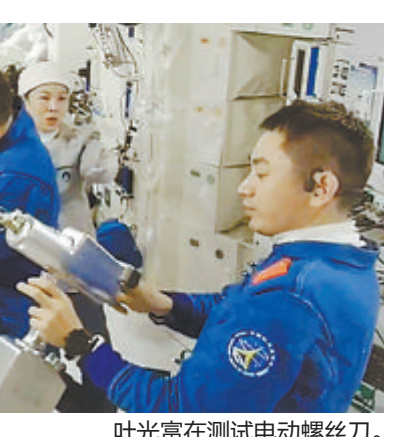
叶光富在测试电动螺丝刀。

通过天和气闸舱的定向摄像机,央视播放了航天员乘组进行紧急撤离演练的情况;王亚平和叶光富迅速关闭了相关舱门,仅用几分钟,三名航天员就撤离到返回舱,整个演练天地配合顺畅,处置快速得当。专家称,空间站整个设计以航天员的生命安全为最高、最严格标准,所以考虑了各种故障预案,包括舱内失火等都在故障预案设计范围内。