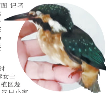
翠鸟没有明显外伤,已恢复意识。

本报讯(文/图 记者 张玉榕)近日,鹭江道一餐厅,有一只小翠鸟晕倒在边上。这只翠鸟大意了,它判断失误,飞行中撞上了餐厅玻璃。