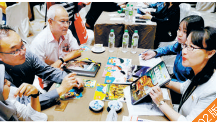
东南亚中国图书巡回展在马来西亚举办。(资料图)

首批国家文化出口基地第二次综合评价结果出炉,厦门自贸片区国家文化出口基地蝉联功能区类第一名