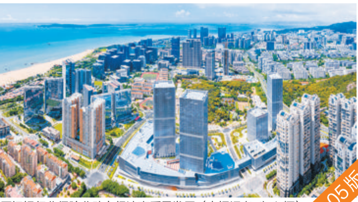
厦门银行业保险业助力经济高质量发展。