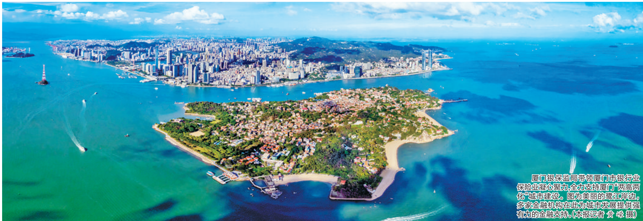
厦门银保监局带领厦门市银行业保险业凝心聚力，全力支持厦门“两高两化”城市建设。图为美丽的鹭江岸边，多家金融机构在此为城市发展提供强有力的金融支持。

>>编者按 经济兴、金融兴，经济强、金融强。党的十八大以来，我市银行业保险业在厦门银保监局的指导下，认真贯彻党中央、国务院决策部署和银保监会党委工作要求，全力支持厦门经济社会高质量发展，坚决打赢防范化解金融风险攻坚战，持续深化改革发展。今日起，厦门银保监局、厦门市银行业协会、厦门市保险行业协会联合本报，携手我市金融机构，推出“厦门银行业保险业这十年”系列报道，绘制十年来我市银行业保险业助力厦门高质量发展的“金色画卷”，迎接党的二十大胜利召开。