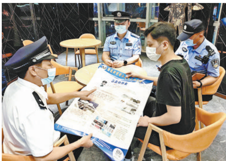
禁毒民警联合派出所、治安部门开展娱乐场所涉毒检查，积极开展禁毒宣传。