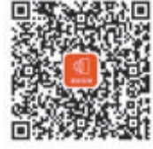
扫码了解详细门店信息