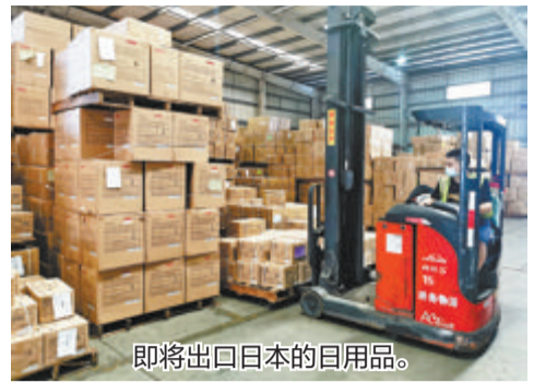
即将出口日本的日用品。