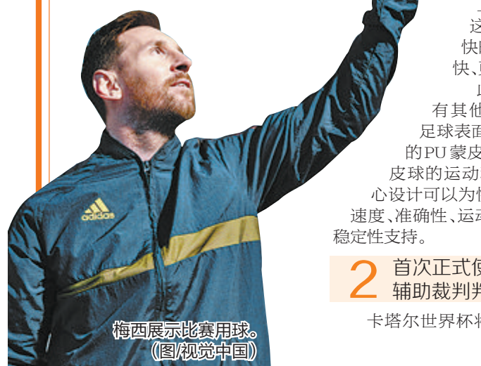
梅西展示比赛用球。

据中新网报道 北京时间12日，国际足联宣布，2022年卡塔尔世界杯将提前一天开赛，由原定的卡塔尔当地时间11月21日调整为当地时间11月20日，东道主卡塔尔队与厄瓜多尔队的比赛将成为赛事揭幕战。赛程调整后，揭幕战开赛时间为卡塔尔当地时间11月20日19时(北京时间11月21日零时)。尽管开赛时间调整，但卡塔尔世界杯决赛依然在12月18日进行。