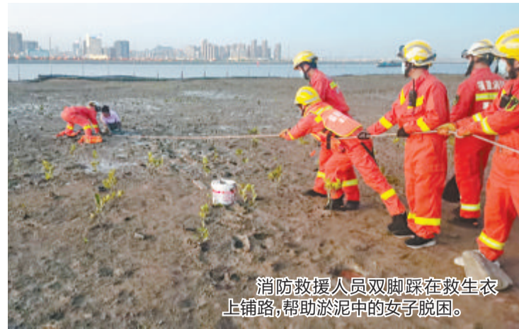
消防救援人员双脚踩在救生衣上铺路，帮助淤泥中的女子脱困。

本报讯(文/图 记者 罗子泓 通讯员 陈雅 傅艺轩)女子深陷泥潭“无法自拔”，消防员用救生衣铺路，慢慢靠近并将她救起。8月11日晚6点，事发海沧区新阳大桥下。