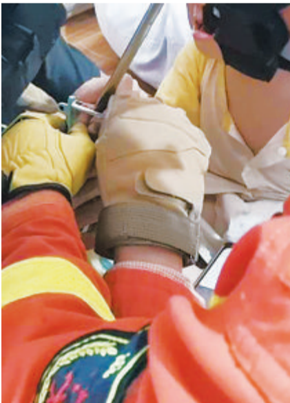
消防救援人员用螺丝刀小心翼翼地撬动削皮器刀片。

本报讯(文/图 记者 罗子泓 通讯员 余艺娟 彭帅) 女童的手指被卡在削皮器里,脸上还挂着两串泪珠。事发8月15日下午2点,翔安区内厝镇赵岗村。消防救援人员用一把螺丝刀,将孩子的小手解救出来。