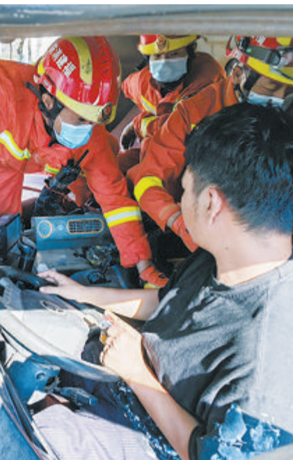
消防人员破拆车门解救司机。

本报讯(文/图 记者 罗子泓 通讯员 余艺娟 林常全) 两车追尾,一名男性司机被困驾驶室。8月14日下午3点左右,事发同安区银城智谷附近。潘涂消防救援站出动两辆消防车和12名消防救援人员前往营救。