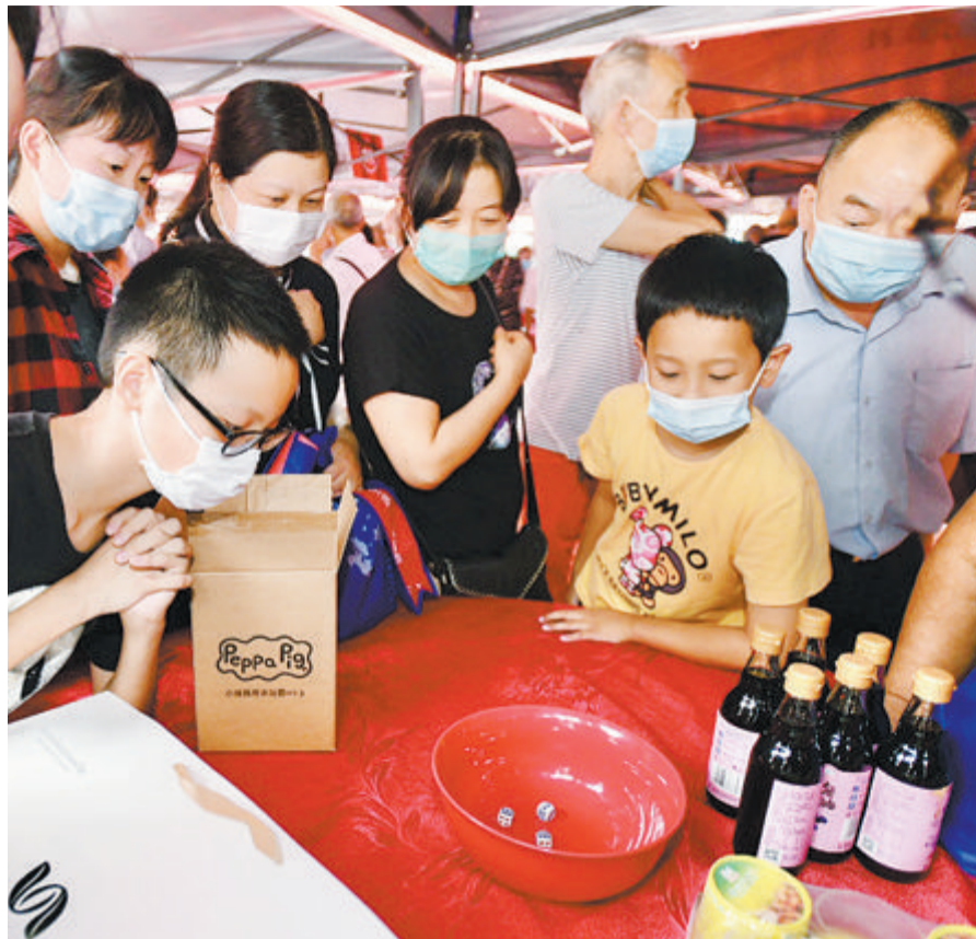
厦门中秋博饼文化节深受市民喜爱。图为市民热情参与订报博饼。（本报资料图）

打开手机，扫描上方二维码即可线上订报，使用微信和支付宝都可付款。下单后，本报发行员将带着订报发票、博饼参赛卡（须符合订报博饼资格）上门服务。