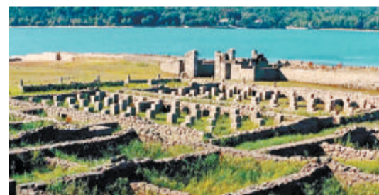
古罗马建筑遗址重见天日。

据中新网报道 受欧洲严重高温干旱天气影响，近日，西班牙加利西亚自治区一条河流水位走低，一处古罗马建筑遗址重见天日，现场画面颇为壮观。 此处建筑群最初是一座军营，建于公元75年，有1900多年的历史，于几个世纪前被废弃。1949年当地修建大坝后，遗址被完全淹没。 报道说，此处建筑群由多个军营、两个粮仓、医院、一座寺庙和温泉浴场组成，在全盛时期曾容纳多达600名古罗马士兵。