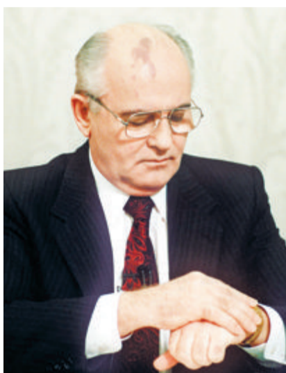
▲1991年12月25日，戈尔巴乔夫发表辞职演说前查看手表上的时间。

戈尔巴乔夫出生于1931年3月2日，1952年正式加入苏联共产党，1955年参加工作。1971年，戈尔巴乔夫进入苏联共产党中央委员会，1980年成为苏联共产党中央政治局正式委员。1985年，戈尔巴乔夫出任苏联共产党中央委员会总书记，成为苏联最高领导人。1990年，他当选苏联第一任也是最后一任总统。1991年12月25日，戈尔巴乔夫宣布辞职，苏联正式解体。