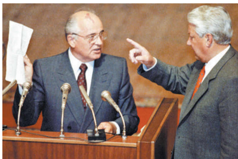
▲1991年8月23日，戈尔巴乔夫(左)和俄罗斯联邦总统叶利钦在最高苏维埃特别会议上。