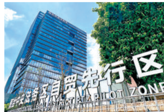
▲海丝中央法务区自贸先行区搭建海上世界国际法务运营平台。

下一步,厦门还将以打造法务科技创新聚集地为愿景,全方位融入“数字经济”发展大局,促进更多法务科技技术成果转化落地,助力“数字福建”建设。