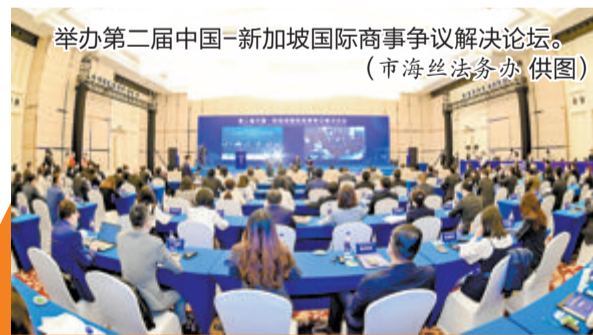
举办第二届中国-新加坡国际商事争议解决论坛。