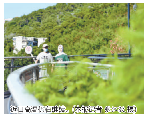
近日高温仍在继续。