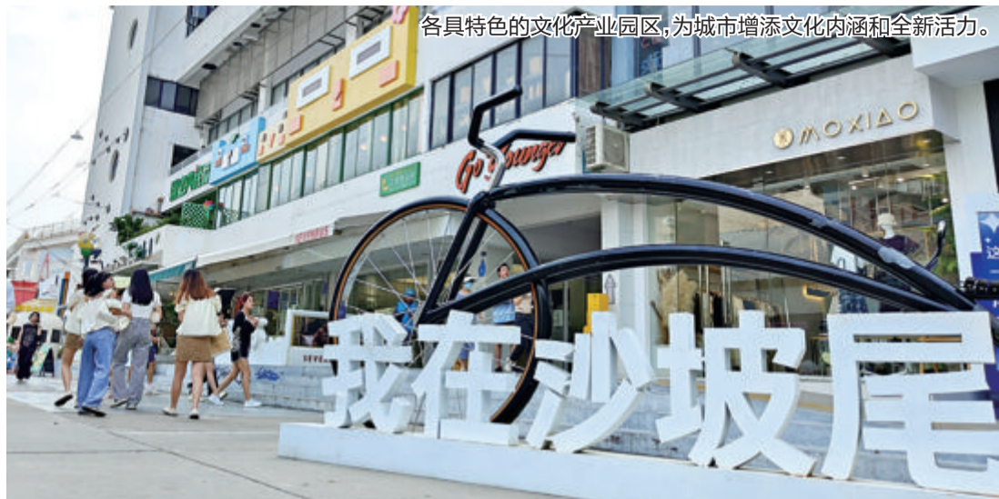
各具特色的文化产业园,为城市增添文化内涵和全新活力。