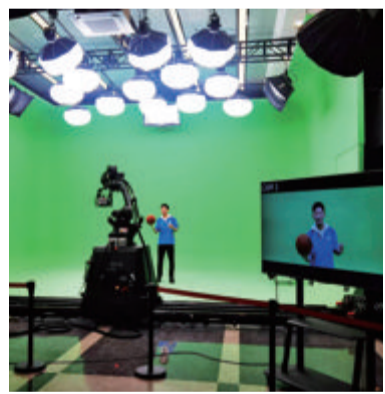
▲基地的数字虚拟影棚是福建首个把虚拟拍摄技术和MOCO机械臂摄影机控制系统结合使用的摄影棚。

据介绍,截至今年8月底,基地(拓展区)成功招商市域外企业71家,营业收入稳步增长,厦门智能视听产业发展初现稳健生态。