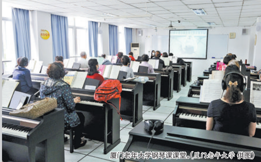
厦门老年大学钢琴课课堂。