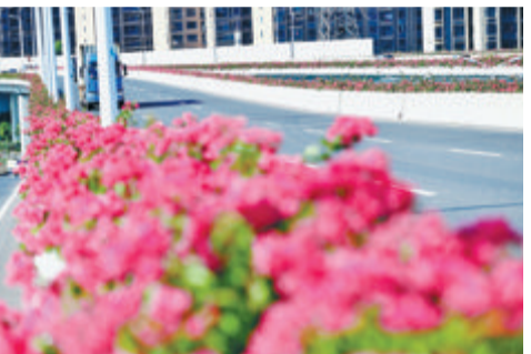
▲海沧区孚莲路高架上的三角梅连接成片,摇曳生姿。

文/本报记者 谢嘉迪 近期,市花三角梅颇有“艳压群芳”之势——道路边、天桥上,一丛丛三角梅进入盛花期,为厦门这座生态文明之城添上了一抹亮丽红妆。