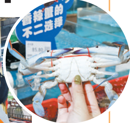
▲螃蟹等海鲜“轻装”上阵，“松绑”销售。