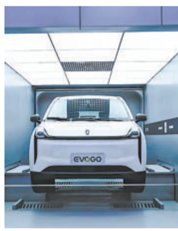
▲展览上,宁德时代智能换电站引人注目。

本次展览在彰显金砖元素的同时,紧跟行业发展趋势,涵盖了科技创新、新能源汽车、金融、能源材料、航空航天、食品消费、生物医疗等诸多领域。