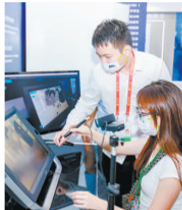
▲图为中远海运集团展位。