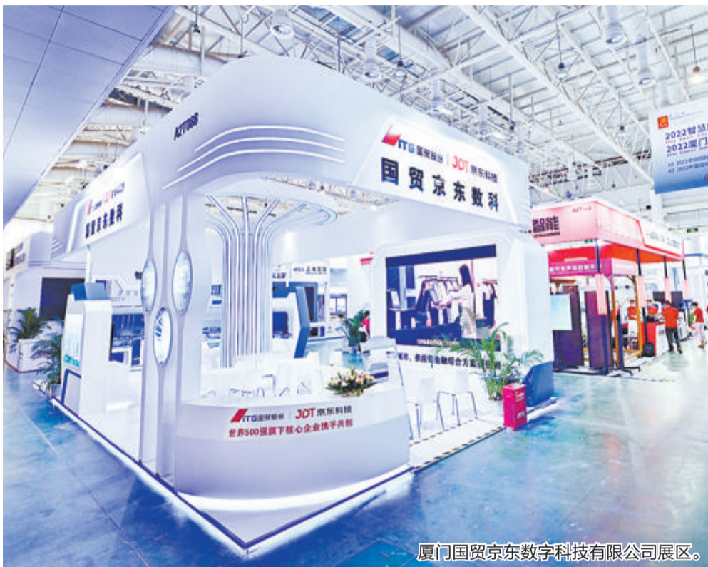
厦门国贸京东数字科技有限公司展区。

此外,国贸股份还受邀参加福建省商务厅、厦门市人民政府、中国石化物资装备部共同主办的绿色化工产业高峰论坛,与各方共商绿色发展机遇。