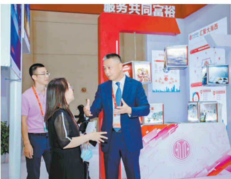
中信银行厦门分行首次亮相投洽会,为海内外客商提供综合金融服务。

另外,该行还充分践行应延尽延、应贷尽贷等政策举措,为中小企业纾困解难。截至今年上半年,中信银行厦门分行已通过“无还本续贷”“延期还本付息”等多种方式给予受困企业续贷支持,累计投放金额超2000万元。此外,该行面向初创企业推出了服务手续费优惠政策,多种线上金融产品、信用产品也在持续普惠小微企业,并在今年7月荣获2022年厦门市中小企业服务月活动“优秀服务机构”荣誉称号。