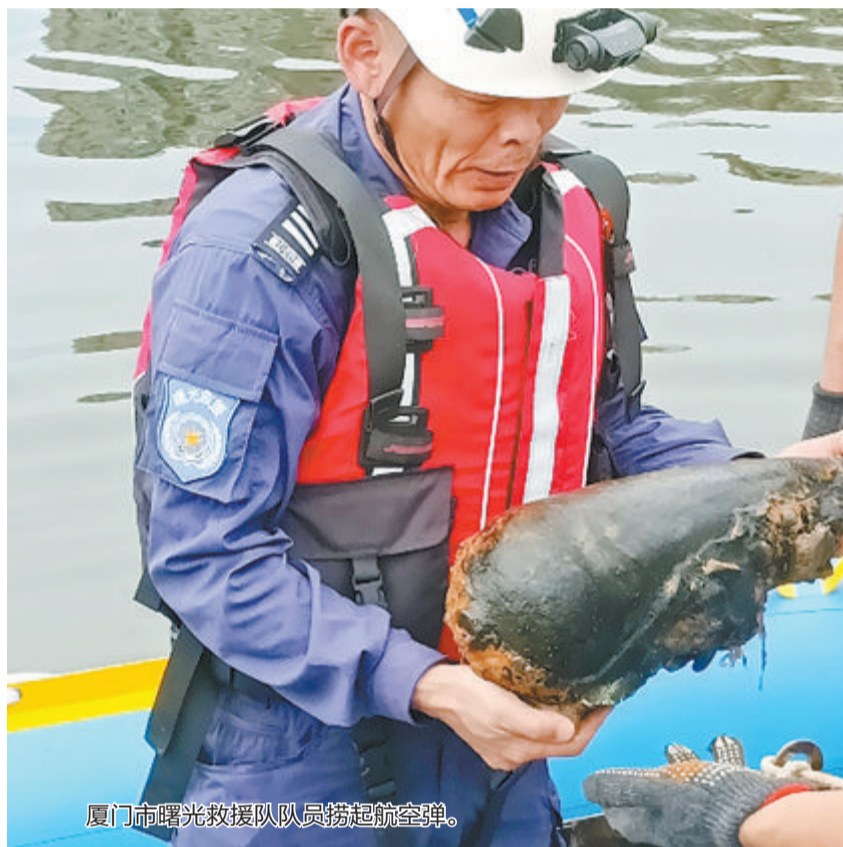
厦门市曙光救援队队员捞起航空弹。

接到任务后,在厦门高崎机场待命的“B-7345”机组在做好飞行评估和各项准备后,第一时间出动救援。考虑到伤员腿骨断裂,大量出血,已出现昏迷症状,随时有生命危险,机组决定,在接到伤员后直飞厦门大学附属翔安医院救治。上午10时27分,“B-7345”救助直升机从厦门高崎机场火速赶赴现场。经过近一小时航路飞行及目标搜寻,机组于11时24分发现目标渔船,通过绞车吊运的方式,先后将受伤渔民和1名陪同人员接至机舱,并开始返航。12时06分,救助直升机直落厦门大学附属翔安医院,将伤员转交医院救治。