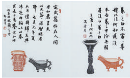
高新月临赵孟頫题跋、王羲之《何如帖》