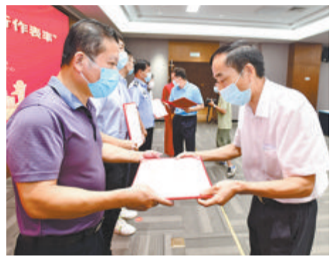
▲颁奖嘉宾为“2021年厦门市垃圾分类网络知识竞赛”获奖代表颁发奖状。

本次活动由厦门市生活垃圾分类工作领导小组办公室指导,厦门市市政园林局、厦门市机关事务管理局主办,厦门市环境卫生中心等承办。