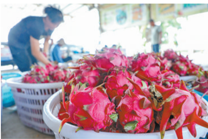
农户收获翔安大宅火龙果。

分至10时30分,授粉时间很短,如果遇到雨水就无法正常授粉,导致减产。”陈锦芳说,翔安区气象局提前预测到当晚当地会有阵雨或雷阵雨“突袭”,于是提前以微信群等方式,通知广大种植户。