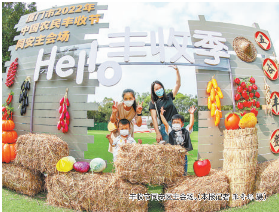
丰收节同安区主会场。

作为厦门“三农”比重最大的行政区,同安区致力深耕希望的田野,着力打造乡村振兴样板区,有力驱动农村美、农业强、农民富的发展快车道,农村各项事业取得可喜成绩。