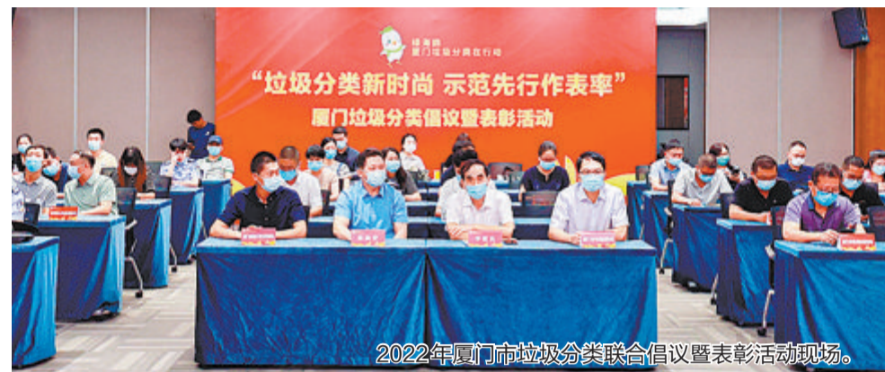
2022年厦门市垃圾分类联合倡议暨表彰活动现场。