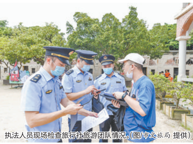
执法人员现场检查旅行社旅游团队情况。

本报记者 吴君宁 规范旅游市场秩序,擦亮文明城市名片。今年以来,市文旅局联合市旅游市场综合执法办公室的各成员单位,梳理机制、打通堵点、提升实效,通过开展常态化部门轮值联合执法检查、建立旅游市场秩序监管执法协作联络机制、优化旅游投诉和涉旅舆情处置流程等方式,共同治理侵害游客合法权益的违法违规行为,保持对扰乱旅游市场秩序违法问题“零容忍、严打击”高压态势,提升来厦游客满意度和我市旅游美誉度。