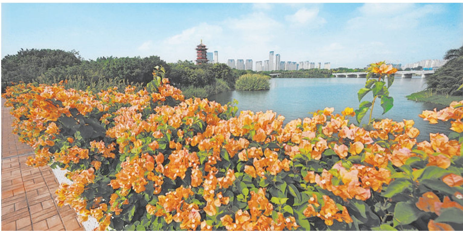
▲园博苑里,三角梅绽放。

9月12日上午,地铁6号线林华段杏滨站至内茂站区间(简称“杏内区间”)顺利实现双线贯通。杏内区间全长599米,其盾构施工途经杏林老城主干道,施工区域建筑密集、管线密布、交通繁忙,盾构掘进期间陆续克服近距离侧穿建楼、小净距正穿民房和涉铁下穿施工等重点难点和风险源。至此,地铁6号线林华段12个正线区间,除官集区间右线剩余矿山法段和内董盾构区间外均已实现贯通,向全线“洞通”又迈出坚实一步。