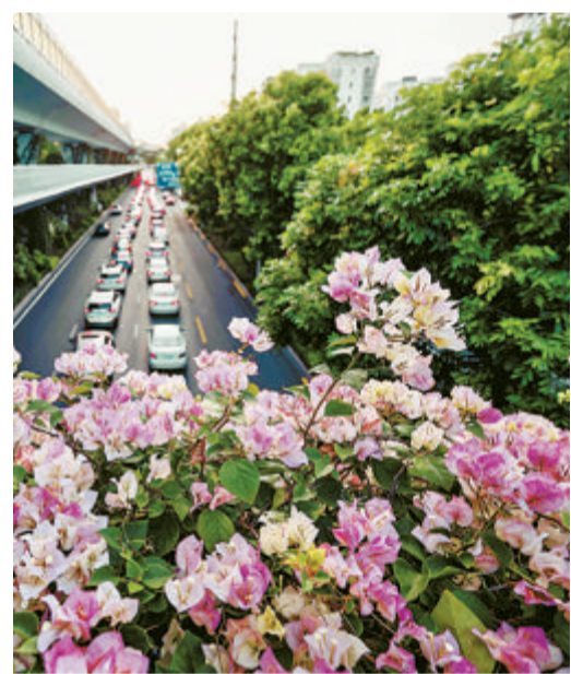
▲外国语瑞景分校附近的天桥上,三角梅盛放。