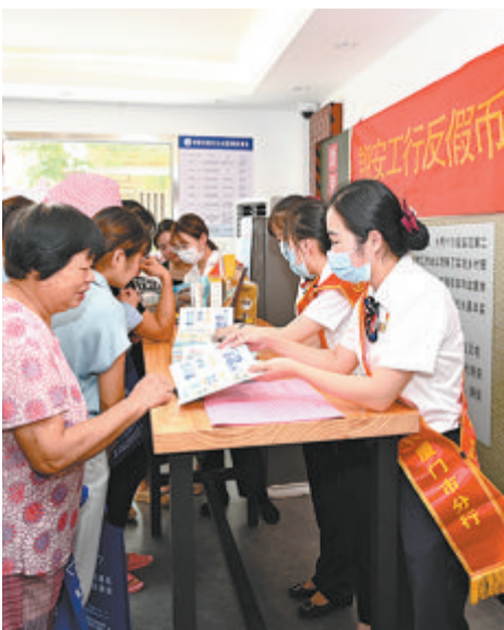
厦门工行走进翔安区内厝镇黄厝村开展“反假货币知识宣传活动”。

在网点周边，该行工作人员利用双休日或上门入企服务时间，深入社区村居、企业工厂、农贸市场、商圈商铺，为村民、学生、老年人、个体工商户、务工人员等重点人群讲解人民币防伪特征、普及人民币反假知识，获得了广泛好评。