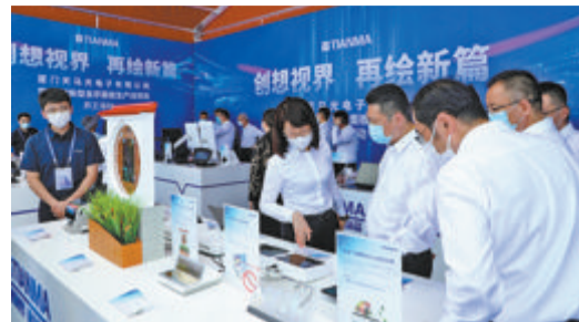
在昨日的开工现场，天马集中展示了公司的最新技术和产品。