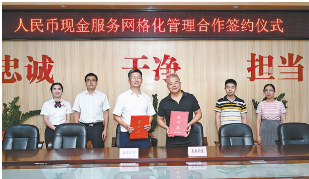
人民币现金服务网格化管理合作签约仪式

同日，厦门工行走进翔安区内厝镇黄厝村“农村反假货币服务站”，开展“反假货币知识宣传活动”。9月，全国启动了以“杜绝假币 共建和谐”为主题的“2022年反假货币宣传月活动”，该行携手各支行网点开展了形式多样的宣传活动，向社会公众普及人民币防伪特征和辨别假币的方法，增强社会公众的反假意识，保护个人资金安全。