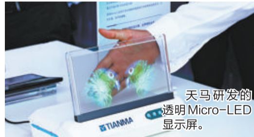
天马研发的透明Micro-LED显示屏。