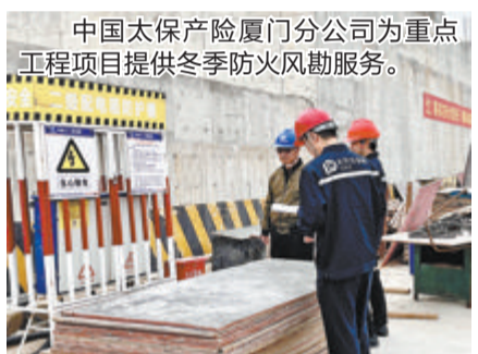
中国太保产险厦门分公司为重点工程项目提供冬季防火风勘服务。

在服务平安厦门方面,联合厦门交警推出首家即取车管业务便民服务中心,实现交管业务与保险业务全方位服务;首家推广双盲区警示系统,提升大货车驾驶安全系数;建设农村智能交通劝导站,通过智能“交警”开展交通安全宣传,劝纠交通安全违法行为,保障农村交通安全。