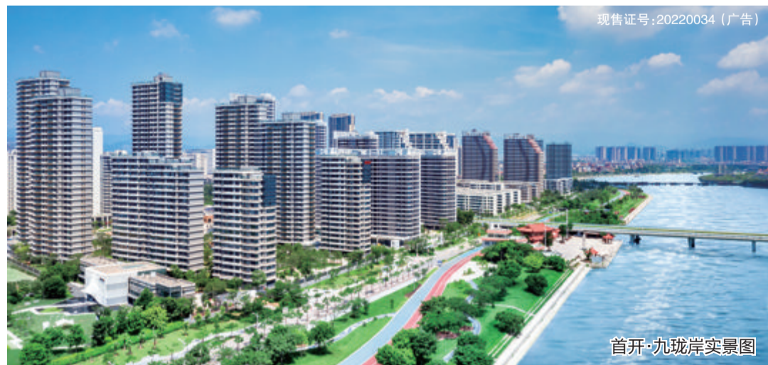
首开·九珑岸实景图

作为厦门跨岛发展的主阵地、主战场、主引擎,同时也是厦门科学城的核心区,近年来,首开·九珑岸所在的环东海域同安新城加速崛起——美峰创客谷、银城智谷、环东云谷三大高新产业园接踵布局,以科技研发、信息服务为主导的新经济聚集发