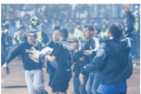
人们在体育场内转移受伤人员。新华社发

新华社雅加达10月2日电 印度尼西亚警方2日说,印尼东爪哇省玛琅市坎朱鲁体育场内发生暴力事件。据悉,事件发生在玛琅阿雷马足球俱乐部和佩尔塞巴亚足球俱乐部的比赛结束后,当时约有4万人正在观看比赛。