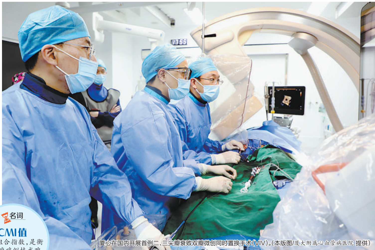
厦心在国内开展首例二、三尖瓣衰败双瓣微创同时置换手术(ViV)。