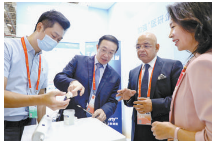
厦心技术成果亮相“九八”投洽会。