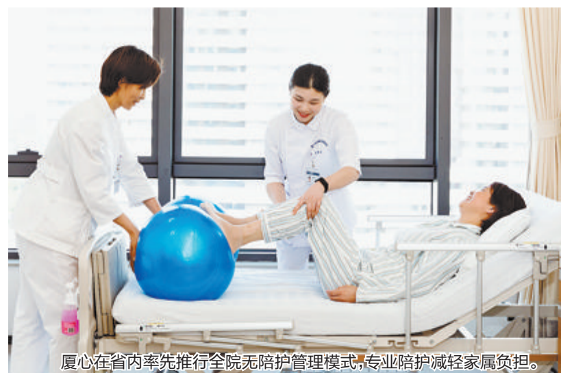
厦心在省内外率先推行全院无陪护管理模式,专业陪护减轻家属负担。