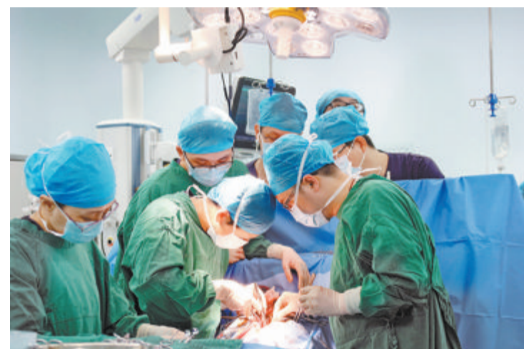
厦心常规开展心脏移植技术。