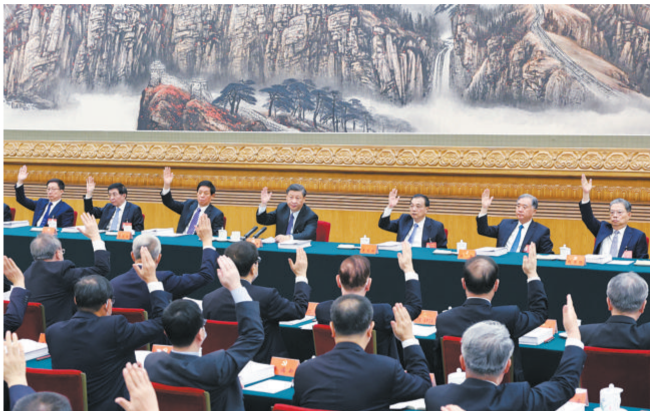
10月21日,中国共产党第二十次全国代表大会主席团在北京人民大会堂举行第三次会议。习近平同志主持会议。