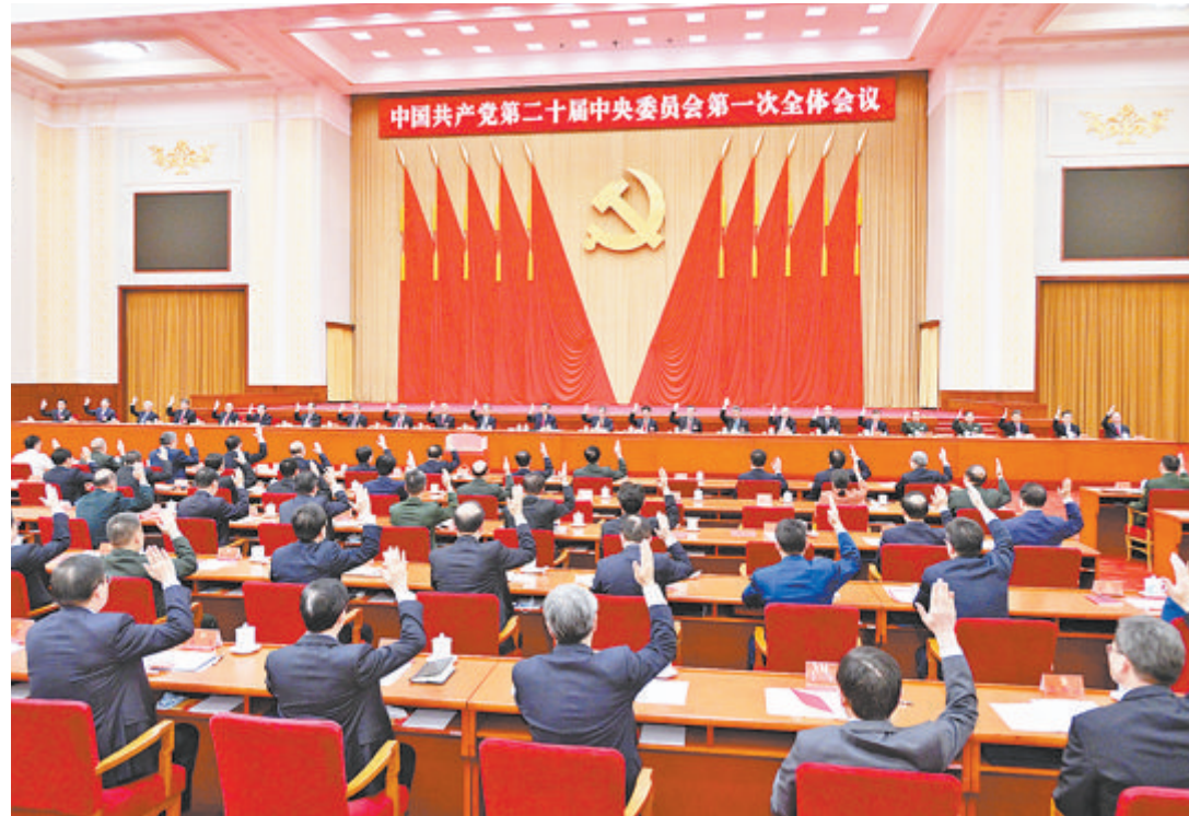
▲10月23日，中国共产党第二十届中央委员会第一次全体会议在北京人民大会堂举行。