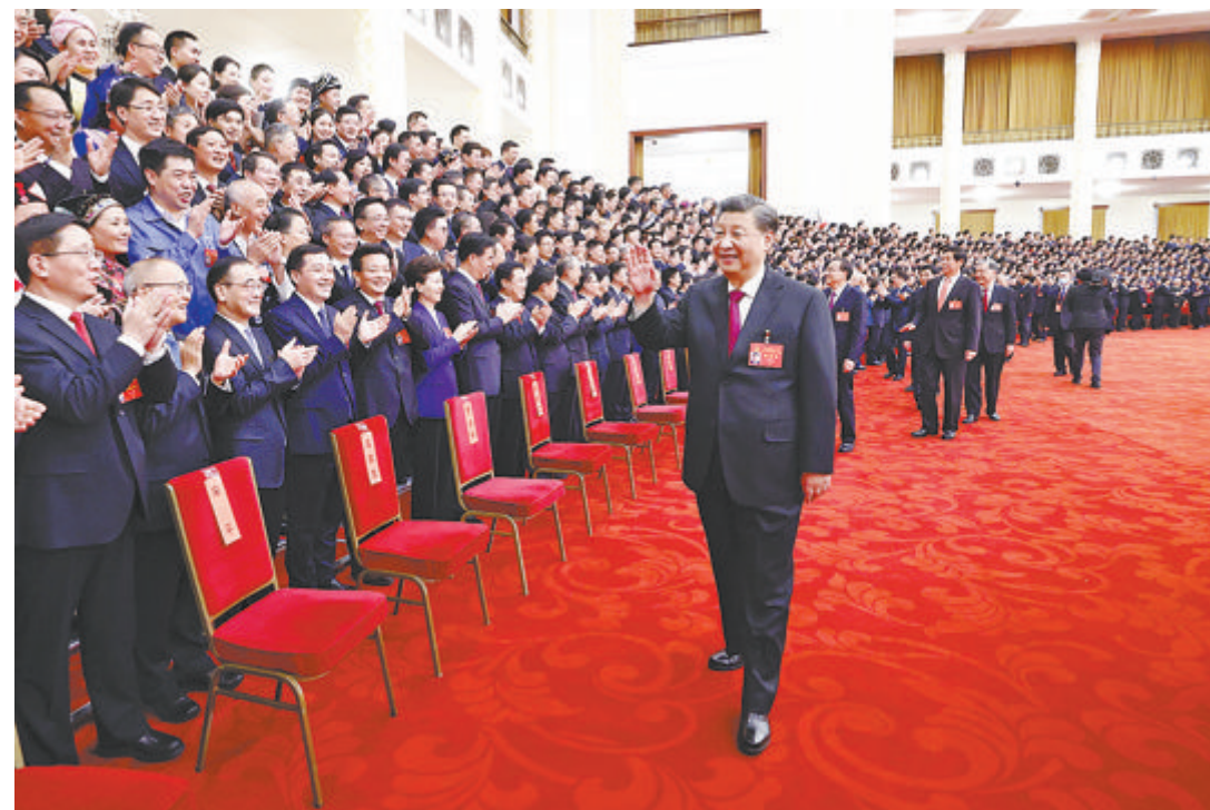
▲10月23日下午，中共中央总书记、国家主席、中央军委主席习近平等领导同志在北京人民大会堂亲切会见出席党的二十大代表、特邀代表和列席人员，并同大家合影留念。

新华社北京10月23日电 中共中央总书记、国家主席、中央军委主席习近平23日下午在人民大会堂亲切会见了出席党的二十大代表、特邀代表和列席人员，并同大家合影留念。