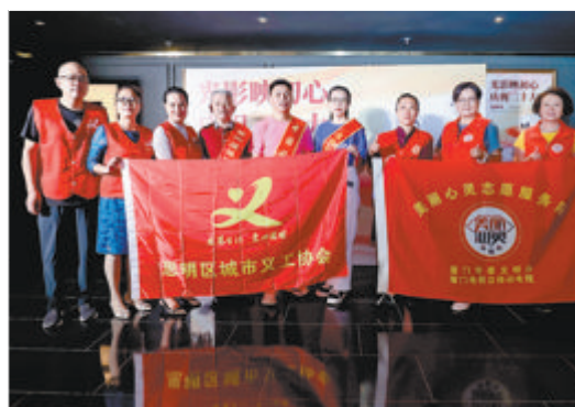
▲活动邀请道德模范和志愿者观影。 ▼思明区影院联盟沙龙活动现场，有关部门代表和影院代表沟通交流。

思明影院联盟的成立，是思明区有关部门团结联系辖内影院，帮扶影院行业纾困发展的创新尝试。思明区文发办相关负责人表示，思明影院联盟建立了企业和政府部门间的直接沟通渠道，便于企业及时反映诉求和建议，为思明区更新助企纾困政策工具箱提供更科学的依据，也为全区影视文化产业的长远发展汇聚力量。一名影院代表认为，联盟的成立将加强同行间的联络互动，便于影院联动开展活动，进一步激发市场活力。