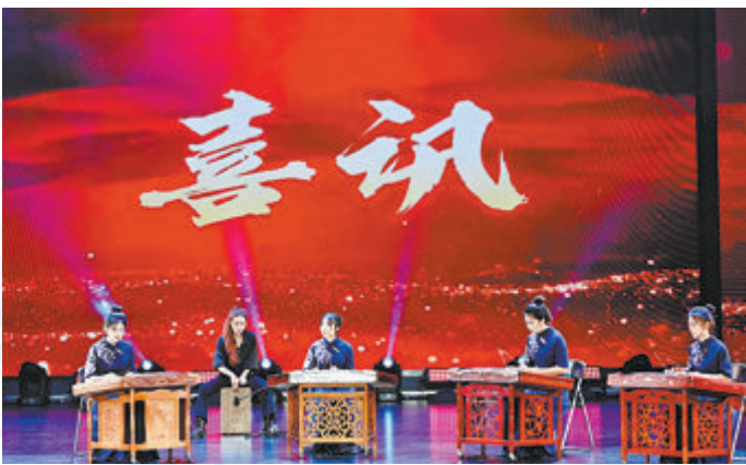
▲华大学子带来器乐重奏《喜讯》。