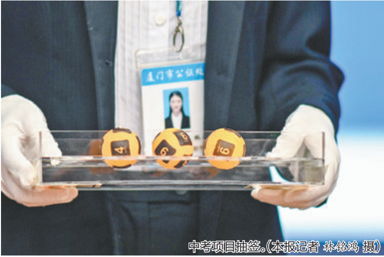
中考项目抽签。

整个摇号过程类似体育彩票开奖,即工作人员把代表项目的小球放进摇号机,由家长代表启动摇号机,摇出的小球即是抽中项目。厦门市2023年中考体育项目因此确定(见附表),其中,抽考项目抽中排球,这也是这个项目第一次抽中排球。