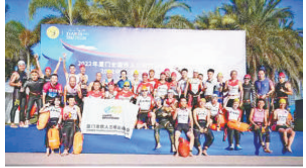
厦门铁三协会会员积极参与赛事。

本报讯(通讯员 高洁)上周日,中国·厦门铁人三项公开赛在环东海域浪漫线圆满落幕,500多名国内外铁人共享铁三盛宴,我市铁人三项运动协会组织一支70多人的参赛队伍,成为盛大赛事中一道最耀眼的风景线。