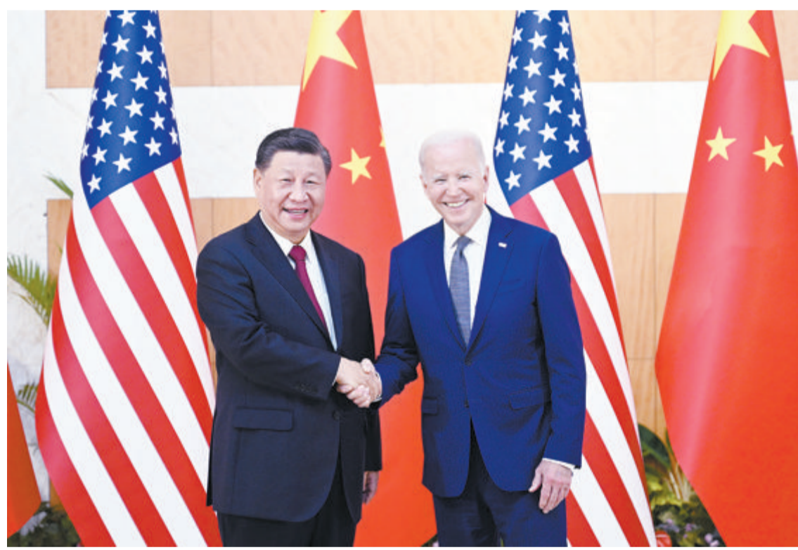
当地时间11月14日下午,国家主席习近平在印度尼西亚巴厘岛同美国总统拜登举行会晤。

习近平指出,世界正处于一个重大历史转折点,各国既需要面对前所未有的挑战,也应该抓住前所未有的机遇。我们应该从这个高度看待和处理中美关系。中美关系不应该是你输我赢、你兴我衰的零和博弈,中美各自取得成功对彼此是机遇而非挑战。宽广的地球完全容得下中美各自发展、共同繁荣。双方应该正确看待对方内外政策和战略意图,确立对话而非对抗、双赢而非零和的交往基调。我高度重视总统先生有关“四不一无意”的表态。中国从来不寻求改变现有国际秩序,不干涉美国内政,无意挑战和取代美国。双方应该坚持相互尊重、和平共处、合作共赢,共同确保中美关系沿着正确航向前行,不偏航、不失速,更不能相