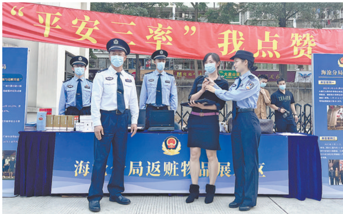
海沧警方2小时快破笔记本电脑盗窃案,4台被盗电脑顺利物归原主。