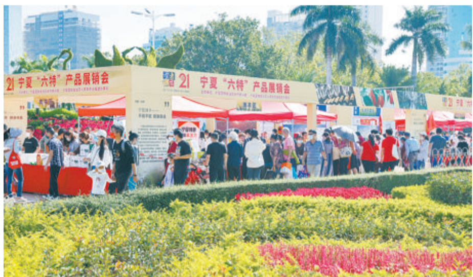
本届读者节宁夏“六特”产品展销会引人注目。

开幕式上，与会领导和嘉宾还共同见证了厦门日报社“新闻大篷车”学习宣传贯彻党的二十大精神全媒体大型采访启动、厦门日报社“潮前智媒”新闻客户端3.0升级上线、文明城市创建金点子系列活动颁奖以及厦门日报社“十佳读者”代表受奖、《老照片 诉说光阴的故事》《集美侨乡最闽南》首发和赠书等仪式。