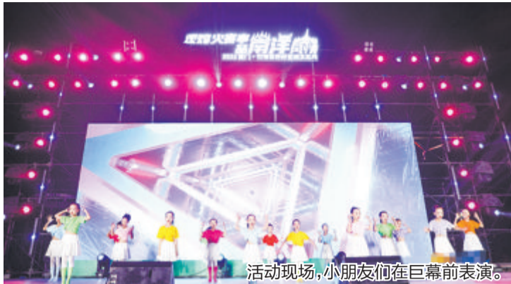
活动现场,小朋友们在巨幕前表演。

0.8米至1.5米 轻到中浪 厦门岛南部海域浪高: 低潮时: 2.15米至2.40米 高潮时: 1.0米至1.6米 13分