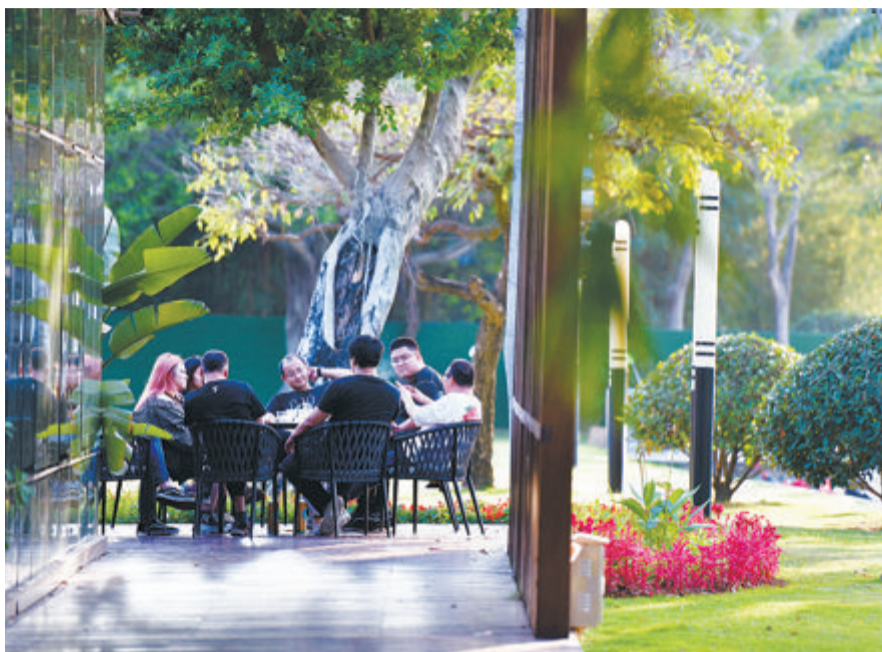
▲上周末,天气晴好,市民在白鹭洲喝咖啡。

本报讯(记者 朱道衡)刚刚过去的周末,鹭岛迎来“十月小阳春”的好天气,白天暖意十足。但昨天傍晚,弱冷空气的先头部队已悄悄抵厦,气象部门预测,这股冷空气将影响到明天清晨,其间,我市气温回落,东北风逐渐增强,后天,新一股冷空气前来增援,带来降水、降温天气。