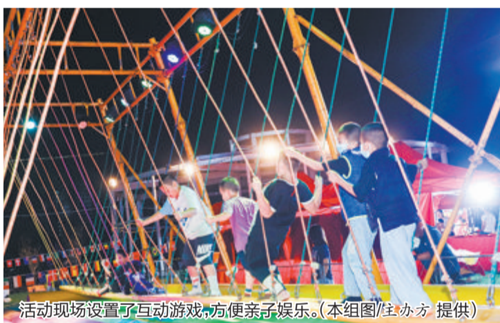
活动现场设置了互动游戏,方便亲子娱乐。

昨晚共度足球狂欢夜的,还有前国家队主教练朱广沪。主办方介绍,接下来的每一周,都将有足球圈神秘嘉宾空降,给大小球迷朋友带来更多惊喜。同时,每周都会增设新活动、新玩法,持续刷新体验。更重要的是,巨型屏幕转播是每天下午5点开启,届时将转播世界杯所有场次比赛。