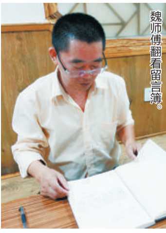
魏师傅翻看留言簿。

厦门是一座有爱的城市,希望在这座城市生活的陌生人之间能互相多一些理解和支持,多一些温暖,多一份关爱。