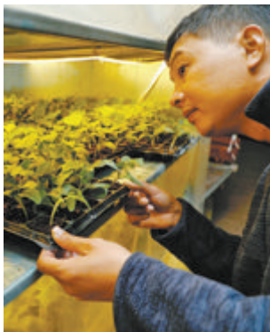
“种苗ICU病房”里恒温恒湿,种苗嫁接后的切口可尽快愈合。

在百利,各种现代化的育种技术和设施应有尽有。从意大利进口的自动化超精良穴盘播种机,实现全程自动化,可节省80%以上的人工;引进丹麦钵钵育苗新技术,通过“空气断根”方式培育根群,定植后开根快,产量可提高10%~25%;引进移动灌溉系统,喷洒均匀系数达90%左右,与地面灌溉相比可节水40%以上,节省劳力50%左右……康英德表示,不仅要向农民提供优良的种苗,更要传播先进的农业技术,带动农业种植的升级,促进农民增收。