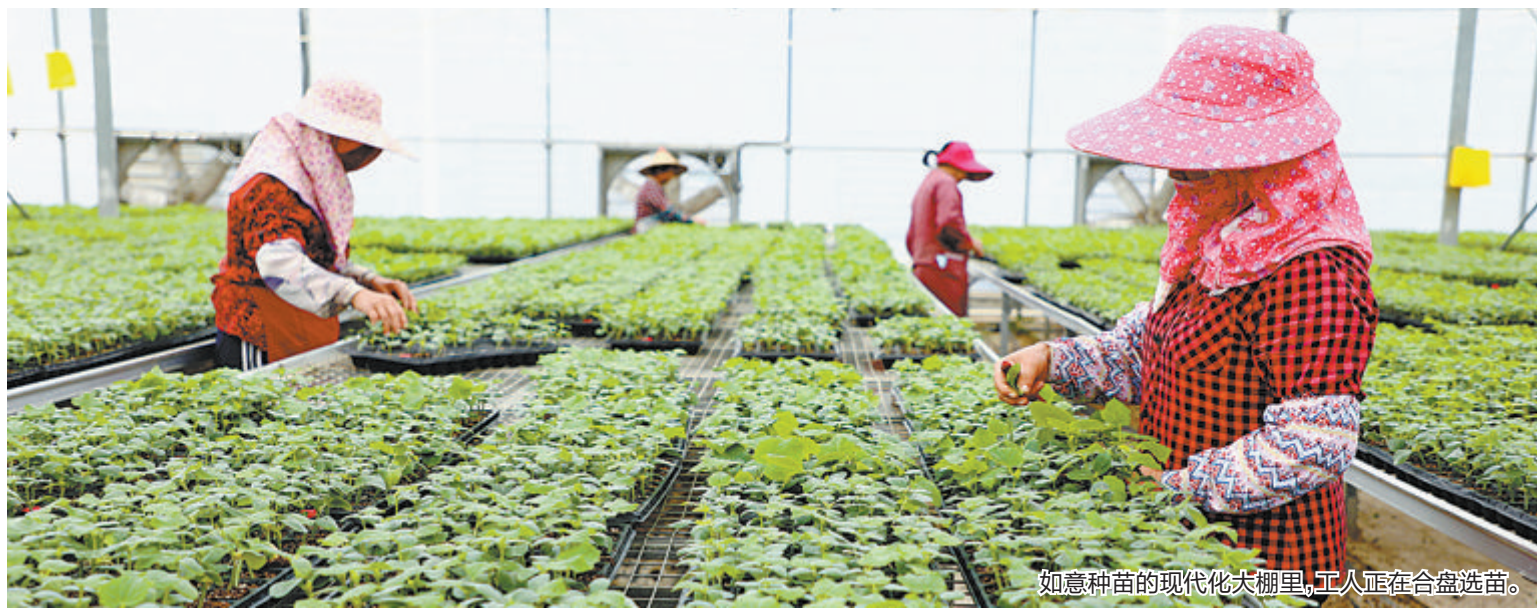
如意种苗的现代化大棚里,工人正在合盘选苗。

我市现有蔬菜集约化育苗企业6家,育苗基地8个,面积共计450亩,主要培育生产茄果类、瓜类以及甘蓝、花椰菜等蔬菜嫁接苗和实生苗,每年生产产品优良、抗病抗逆性强、产量高的蔬菜苗3亿多株,培育的蔬菜苗不仅能满足本市本省的需求,还推广销售到贵州、云南、广西、湖北、广东、江西、浙江等多个省区。