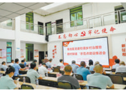
海沧区召开党建引领乡村治理暨跨村联建示范点建设推进会。

党的二十大报告指出,坚持大抓基层的鲜明导向,把基层党组织建设成为有效实现党的领导的坚强战斗堡垒。“海沧区是全市唯一的党建引领乡村治理省级试点区,推进乡村振兴,积极发挥基层党组织的战斗堡垒作用至关重要。”海沧区表示,接下来,将紧紧围绕学习贯彻党的二十大精神,坚持问题导向,聚焦重点难点,进一步增强党组织的政治功能和组织功能,不断提升党建引领乡村治理实效。