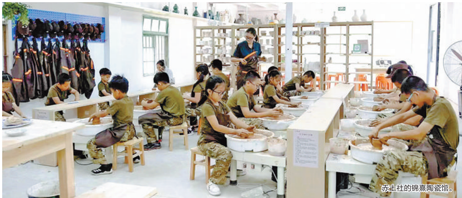
赤土社的锦熹陶瓷馆。