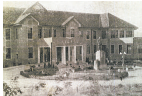
▲1937年,“福建省立医院”在福州吉祥山成立,这是厦门大学附属第一医院的前身。 ▼1953,迁入现址上古街10号,图为医院全景(左起:门诊、病房楼、手术室、营养部、职工食堂)