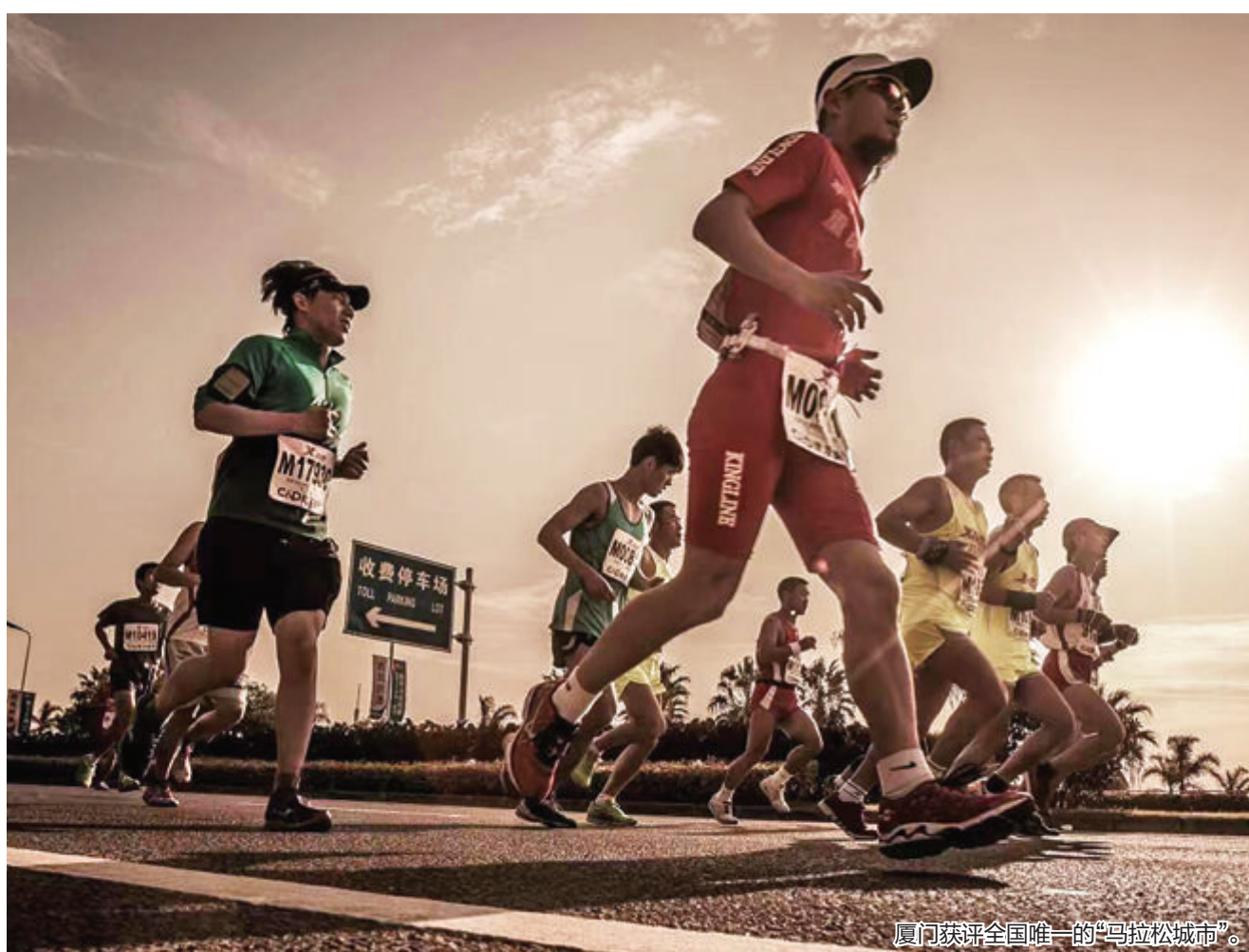
厦门获评全国唯一的“马拉松城市”。

我市先后出台了《厦门市体育设施规划(2019—2035年)》及《厦门市“十四五”全民健身场地设施补短板整体解决方案》等一系列规划和工作方案,近期还将出台《厦门市全民健身设施补短板五年行动计划(2022—2026)》《厦门市体育运动