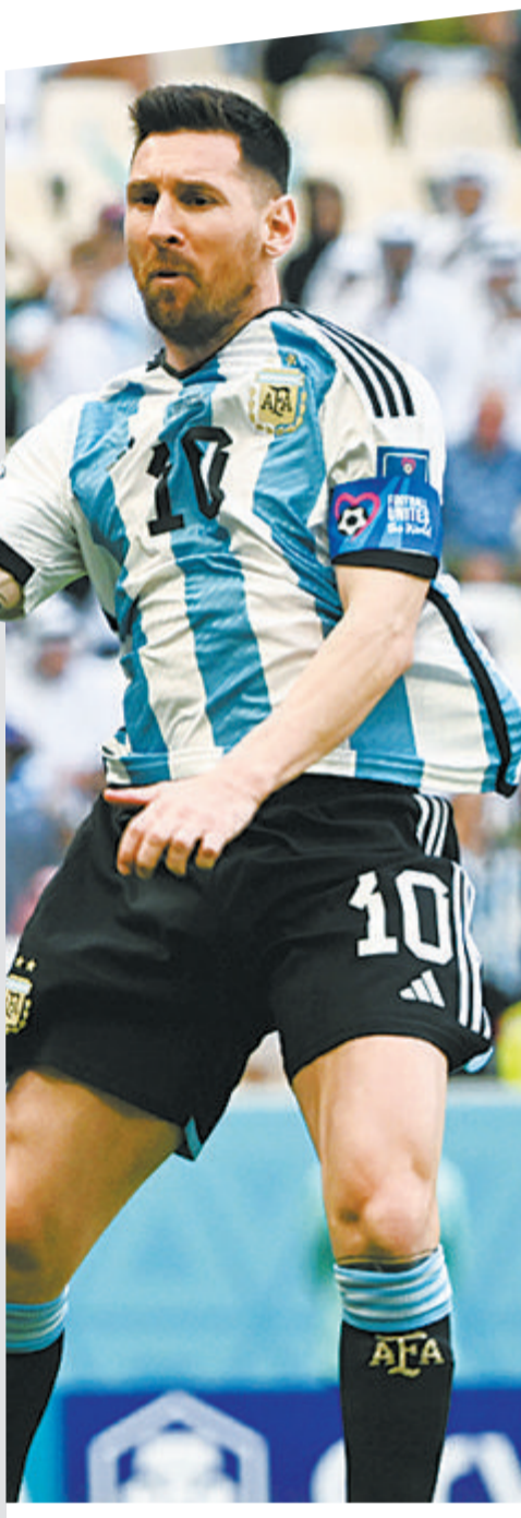
梅西将迎来关键一战。

首轮比赛阿根廷过于轻敌,在沙特队身上“翻车”。次轮一旦“潘帕斯雄鹰”再度输球,“最后一舞”的梅西将提前告别世界杯,而这将是无数梅西与阿根廷的球迷难以接受的。